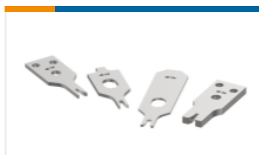
TE 产品编号1-1803712-7 CRIMPER, INSULATION O