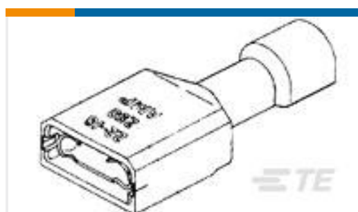
TE 产品编号3-520140-2 ULTRA-FAST 250 ASY REC 16-14 AWG TPBR