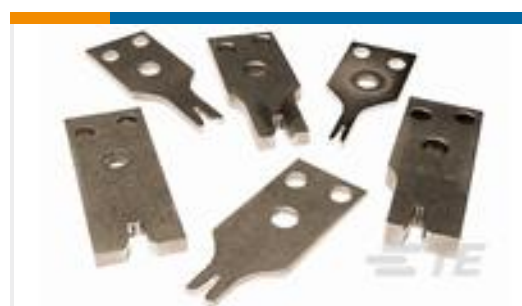
TE 产品编号1633965-1 CRIMPER, INSUL O PREMIUM