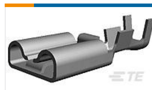
TE 产品编号175024-1 250 PL EX REC. 15-10AWG PTBR