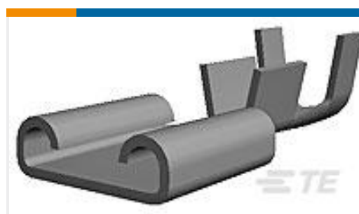
TE 产品编号1-160301-6 250 FASTON,REC.,10-12 AWG,TPBR