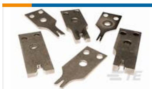
TE 产品编号1-456405-5 CRIMPER, WIRE .080 "F"