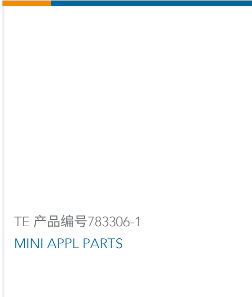
TE 产品编号783306-1 MINI APPL PARTS