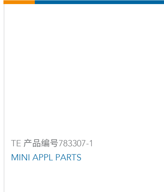
TE 产品编号783307-1 MINI APPL PARTS