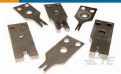
TE 产品编号1-1633730-8 CRIMPER, WIRE F .110 F