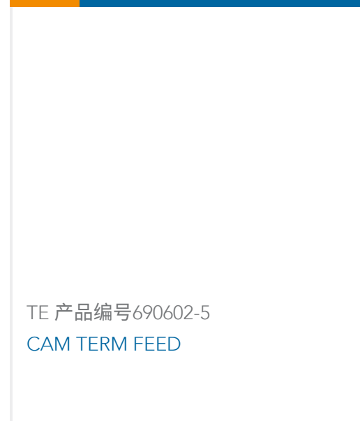
TE 产品编号690602-5 CAM TERM FEED