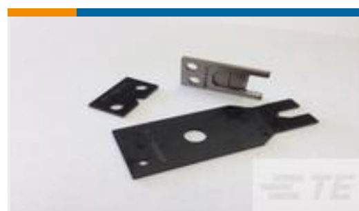
TE 产品编号690474-6 SHEAR BLADE