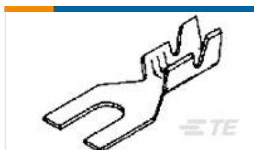
TE 产品编号60773-2 SPADE TERMINAL 18-14 AWG TPBR