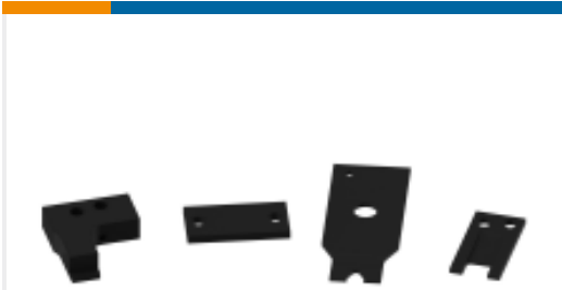
TE 产品编号240644-1 PLATE-REAR SHEAR