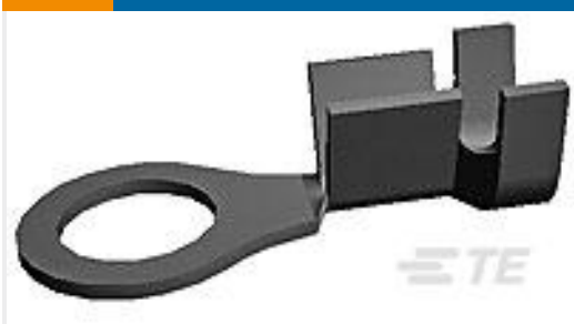
TE 产品编号40955 RING 20-16 AWG .0295 X .390 TPBR