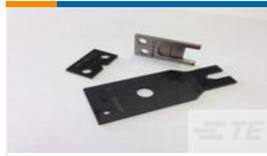
TE 产品编号690474-9 SHEAR BLADE