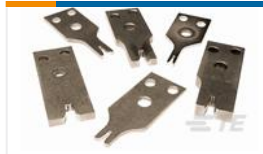
TE 产品编号3-456402-3 CRIMP, WIRE (055F X 135THK)