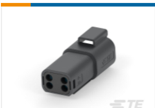
TE 产品编号1-2600030-0 4CCT BLACK RECFP W/LARGE SEAL