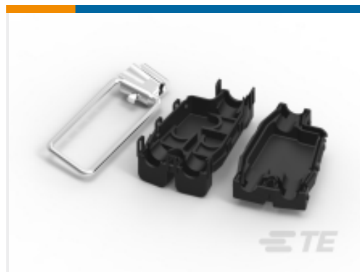
TE 产品编号444751-6 STIRRUP CONN. KIT SMALL