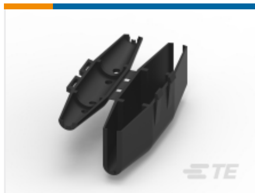
TE 产品编号602061 AMPACT TAP COVER-RED