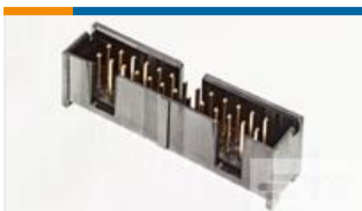
TE 产品编号 1761681-1 IDC LOW PRO HDR 6P VERT HT BLACK