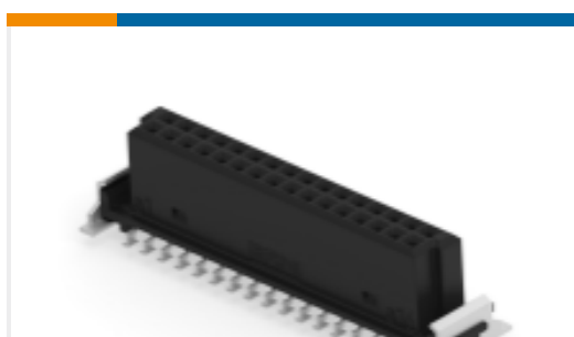
TE 产品编号 354057-E SMCB 32 F AB VV 7-13 CL * H007 137 E002