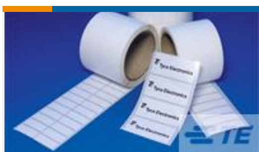
TE 产品编号 9-1768017-9 EET-0825P-9