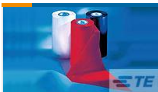
TE 产品编号 143060-000 1330-0600-10