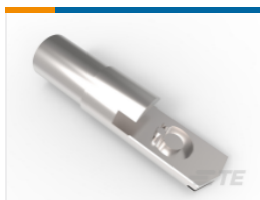
TE 产品编号 53435-1 AMPPOWER QUICK DISC 500MCM