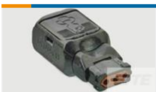
TE 产品编号D369-P33-NS1 369 3 WAY PLUG, CRIMP, SKT