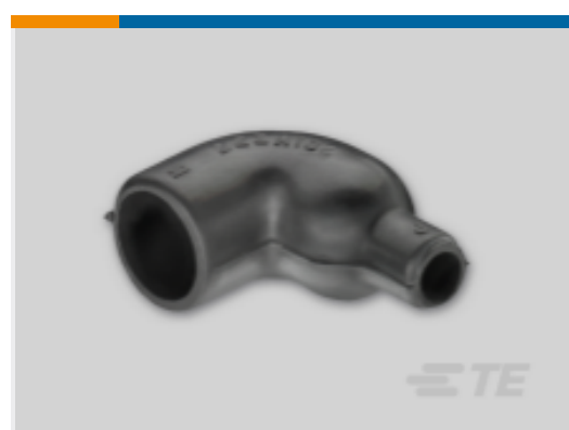
TE 产品编号806823-000 球形热缩护套：有嘴，直角