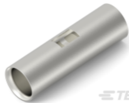
TE 产品编号 52010 SPLICE,COPALUM BUTT 1/0