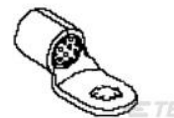
TE 产品编号 51986-3 TERMINAL,COPALUM 1/0 1/2