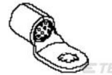
TE 产品编号 51986-1 TERMINAL,COPALUM 1/0 5/16