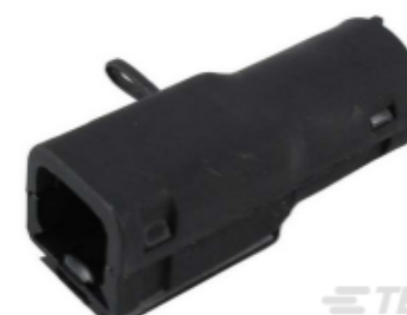
TE 产品编号1028-021-0205 BKSHL, 2P, BLK, REC, ST, NW 7.5/8.5