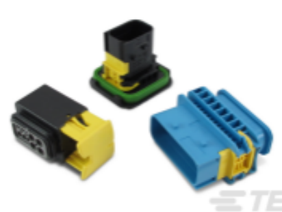
TE 产品编号4-1703841-1 重载密封系列连接器塑壳