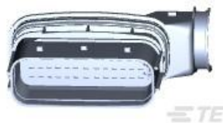
TE 产品编号6-1718323-1 2.8MM TAB HSG.,39POS.,ASSY