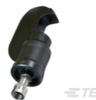
TE 产品编号 69099 HYP8 12-350MCM 18T HEAD