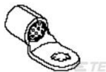
TE 产品编号 51986 TERMINAL,COPALUM 1/0 1/4