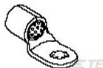
TE 产品编号 51982-1 TERMINAL, COPALUM R 2 5/16