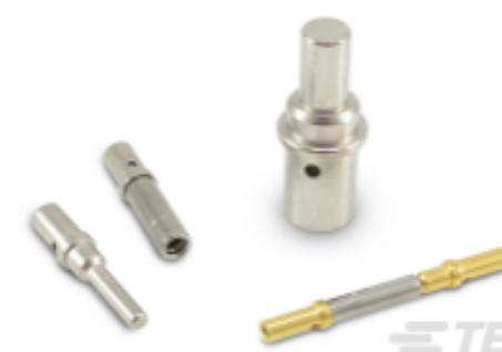
TE 产品编号 0460-202-16141 DEUTSCH Solid Contacts