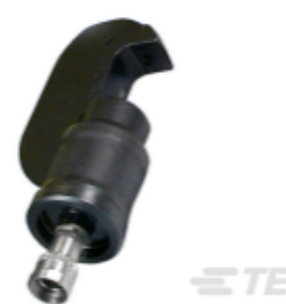
TE 产品编号 1752868-1 HYP10 12-350MCM 18T HEAD