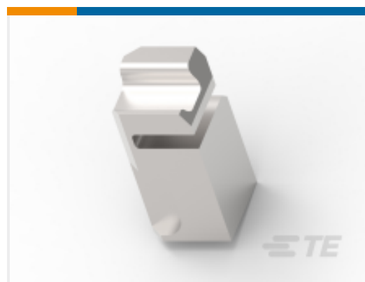
TE 产品编号 454276-1 FLOATING SHEAR