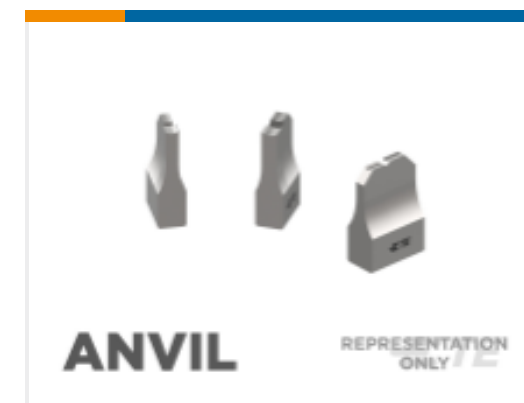
TE 产品编号 464675-3 ANVIL, COMBINATION