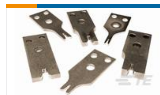
TE 产品编号6-1424909-6 CRIMPER, INSULATION "F"(.240")