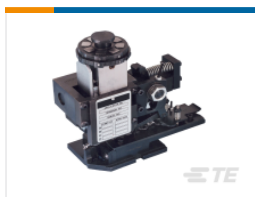
TE 产品编号680588-3 HDM 9HBAPR1405140OG