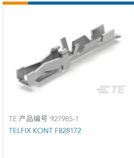
TE 产品编号 927985-1 TELFIX KONT F828172