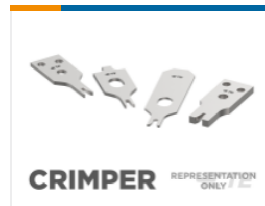
TE 产品编号 3-683454-4 CRIMPER, INSULATION "O"(.055")