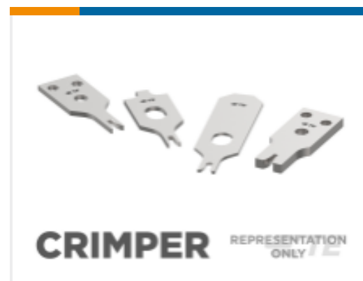
TE 产品编号 2-456401-5 CRIMPER, WIRE .042 F