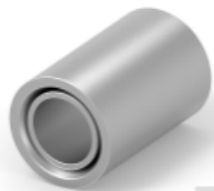
TE 产品编号52750 COPALUM 绞线/实心：并行接头