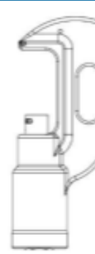
TE 产品编号 69082 HYP8 4/0-1000MCM 26T HEAD