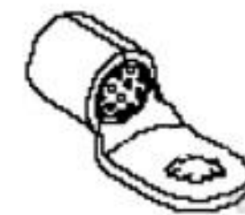
TE 产品编号51989-1 TERMINAL, COPALUM 2/0 5/16