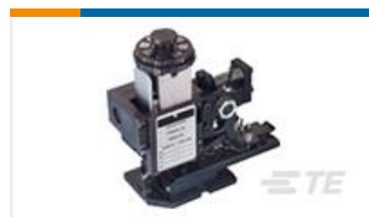
TE 产品编号567408-2 HDMHB 9EAPR160T180O G