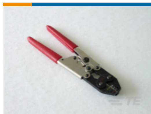
TE 产品编号 992008-000 AD-1377-CRIMP-TOOL-3-CVTY