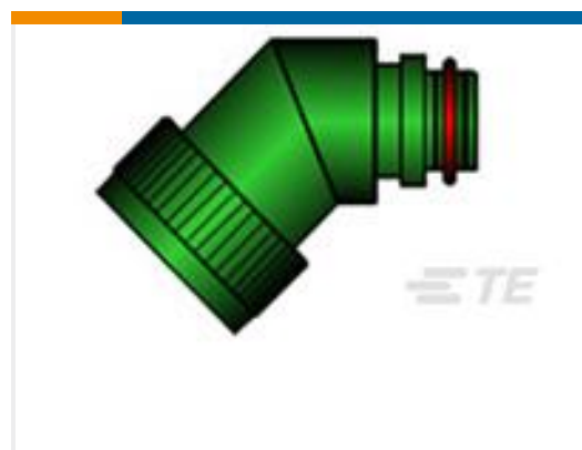
TE 产品编号A05444-000 TXR41AB45-2008BI