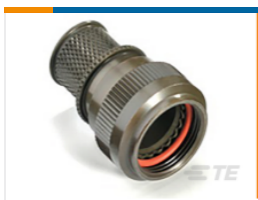
TE 产品编号BTH1-15-08-1-ZN BTH1-15-08-1-ZN