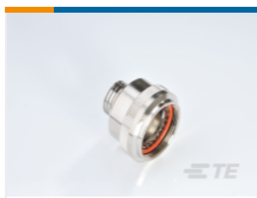
TE 产品编号70A1-20-16-1-B 70A1-20-16-1-B