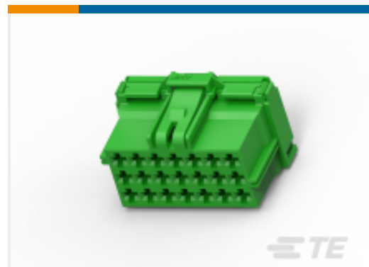
TE 产品编号1534399-2 AMP MCP, 非密封连接器壳体