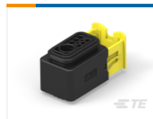
TE 产品编号9-2331355-1 HDSNET 1+6 REC. HSG ASSY D