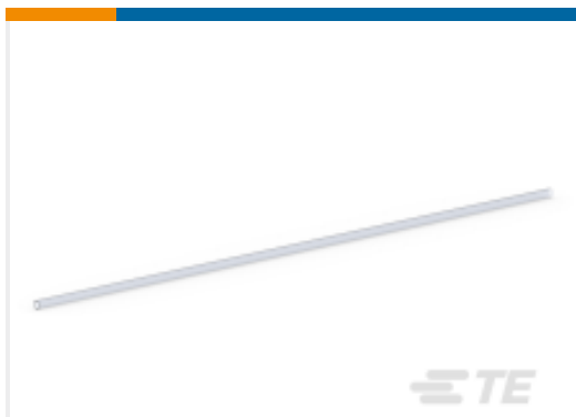
TE 产品编号8549554001 单壁 CGPT 卷轴热缩管