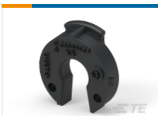
TE 产品编号9-2334942-1 HDSNET COVER FOR SWS