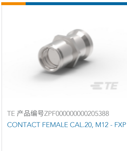
TE 产品编号 ZPF000000000205388 CONTACT FEMALE CAL.20, M12 - FXP