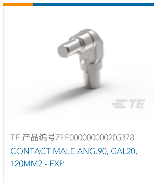
TE 产品编号 ZPF000000000205378 CONTACT MALE ANG.90, CAL20, 120MM2 - FXP