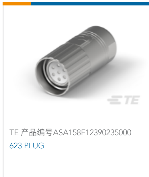
TE 产品编号 ASA158F12390235000 623 PLUG