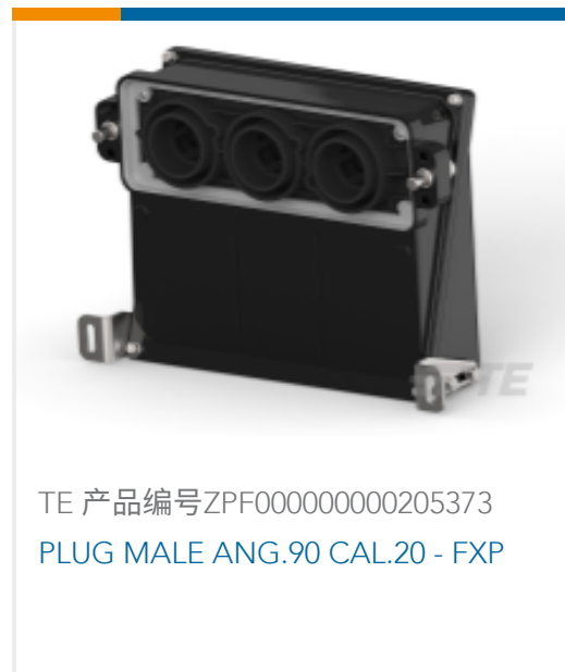
TE 产品编号 ZPF000000000205373 PLUG MALE ANG.90 CAL.20 - FXP