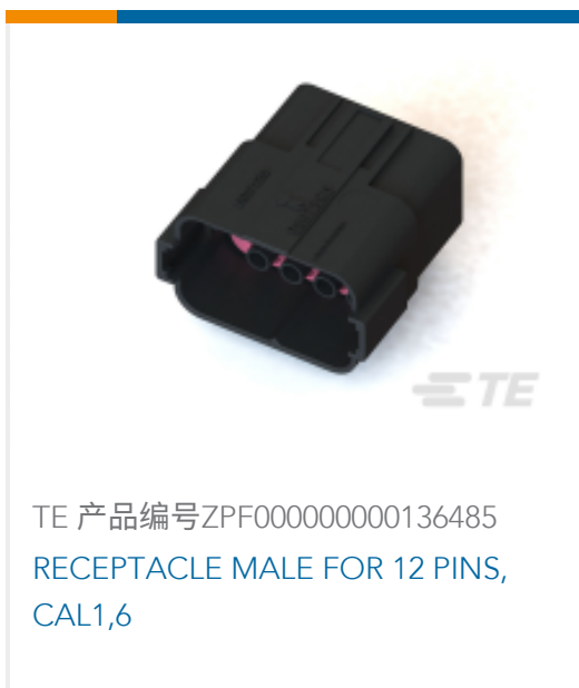
TE 产品编号 ZPF000000000136485 RECEPTACLE MALE FOR 12 PINS, CAL1,6