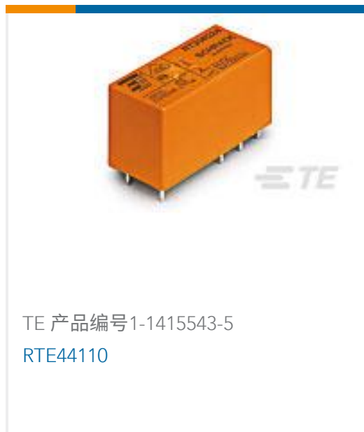
TE 产品编号 1-1415543-5 RTE44110