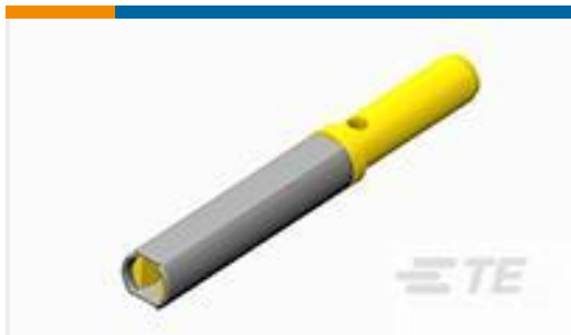
TE 产品编号450213-000 CTA-0165