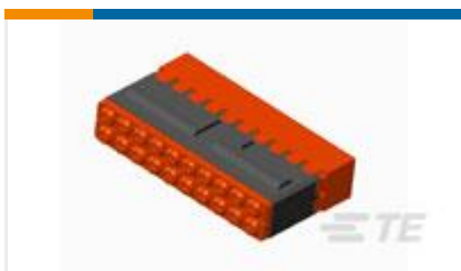
TE 产品编号850957-000 MTCP-122-20PQ