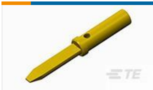
TE 产品编号226335-000 CTA-0166