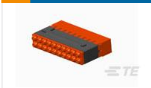
TE 产品编号555747-000 MTCP-122-20PQ2