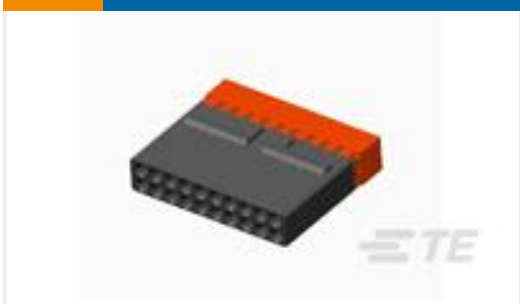
TE 产品编号494203-000 MTCP-122-20S