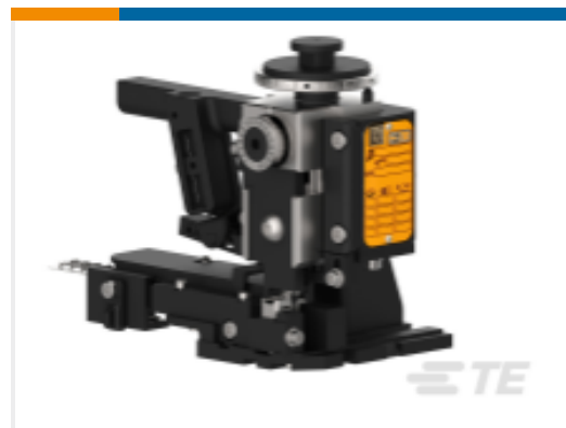
TE 产品编号 2151428-1 OCEAN-2.0-APPLICATOR-S-042F055O-RSM