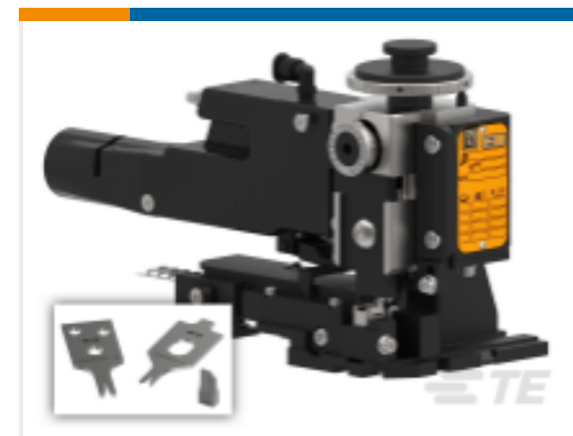
TE 产品编号 7-2837445-2 OCEAN_2.0_Applicator-S-042F062OA