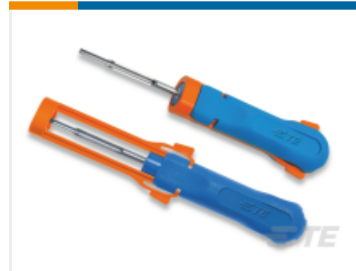
TE 产品编号 1579007-9 EXTRACTION TOOL