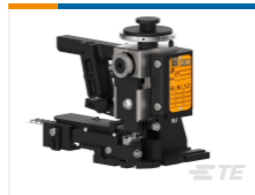
TE 产品编号 5-2151428-1 OCEAN-2.0-APPLICATOR-S-042F055O-RSM