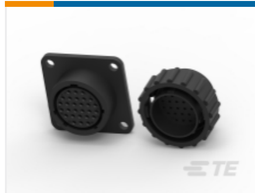
TE 产品编号 CAT-AM71-C83998M CPC Connectors, Series 2