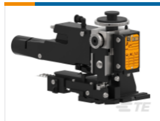
TE 产品编号 2151428-2 OCEAN-2.0-APPLICATOR-S-042F055O-RSA