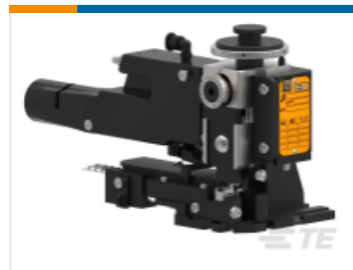
TE 产品编号 2837445-2 OCEAN_2.0_Applicator-S-042F062O-RSA