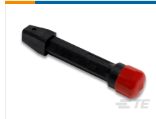
TE 产品编号 91285-1 INSERT/EXTRACT TOOL ASSEMBLY