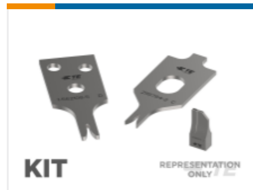
TE 产品编号 7-2837445-7 OCEAN_2.0_SPARE_PART_KIT-042F062O