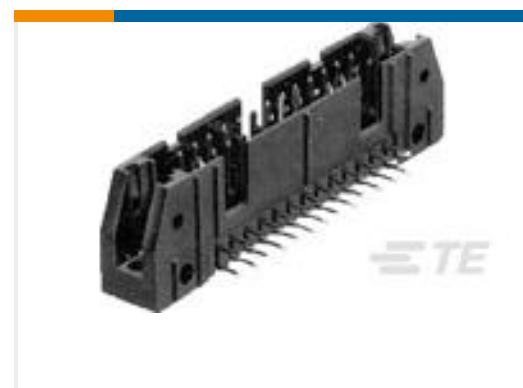
TE 产品编号 5102159-1 A/L UNIV HDR 10P RA