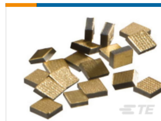
TE 产品编号 GA10K3CG3 CHPG-NTC CHIP THERMISTORS