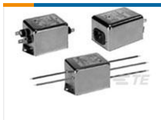
TE 产品编号 1-6609037-0 20EP6=F7810 S0