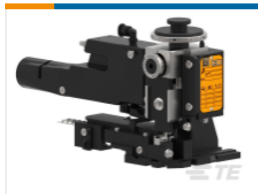
TE 产品编号 5-2151428-2 OCEAN-2.0-APPLICATOR-S-042F055O-RSA