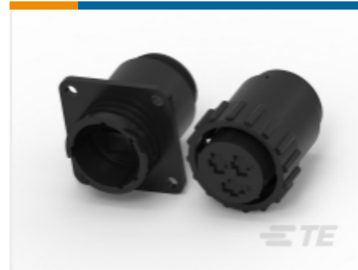
TE 产品编号 CAT-AM71-C83998BB CPC 系列 3