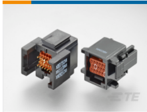
TE 产品编号ABC03N-20P IN-LINE RECP