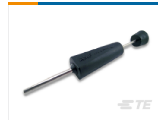
TE 产品编号 305183 EXTRACT TOOL TYPE 2 20-16