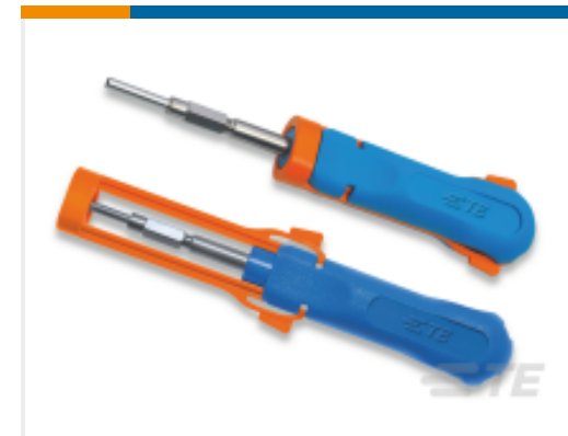
TE 产品编号 539972-1 EXTRACTION TOOL