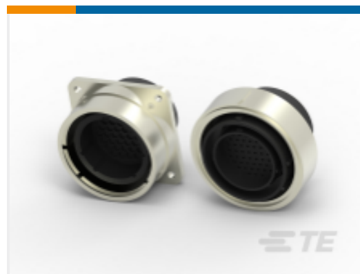
TE 产品编号 CAT-AM71-C83998C Circular Plastic Connector, CMC Series 1