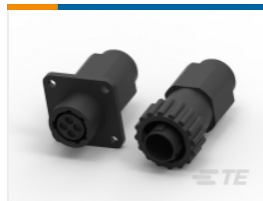
TE 产品编号 CAT-AM71-C83998Y One-Piece Connector, Sealed, CPC Series 1