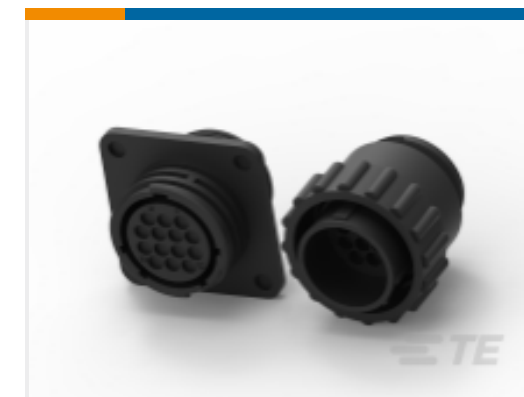
TE 产品编号 CAT-AM71-C83998K Circular Connector, Environmentally Sealed, CPC Series 6