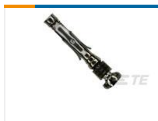
TE 产品编号 66598-9 III+ SKT,18-14,TIN ,STRIP