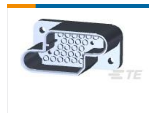
TE 产品编号 211149-1 PIN HSG,25 POSN,METRIMATE