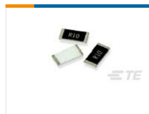
TE 产品编号 2-2176056-7 RLP73K 2B R12 5% 5K RL