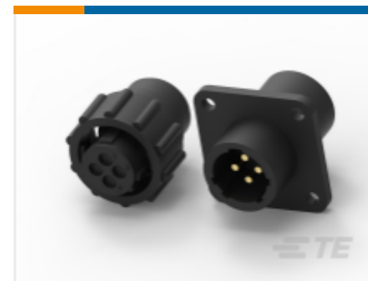
TE 产品编号 CAT-AM71-C83998J Cable/Panel Mount Connector, CPC Series 1