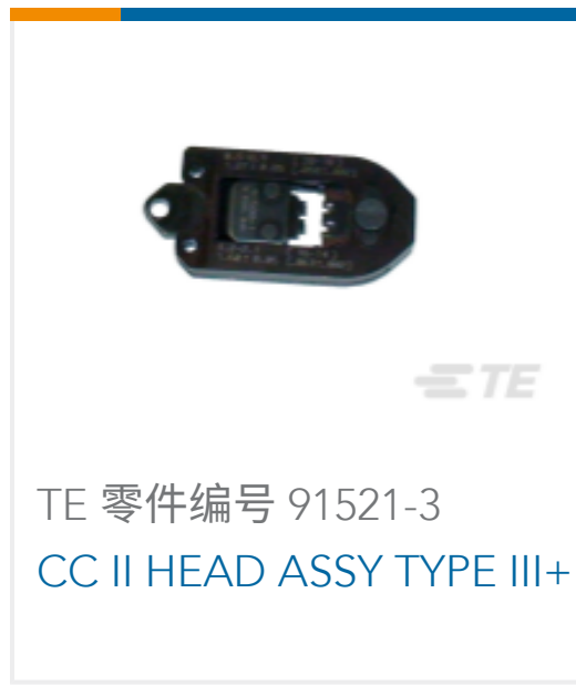
TE 零件编号 91521-3 CC II HEAD ASSY TYPE III+