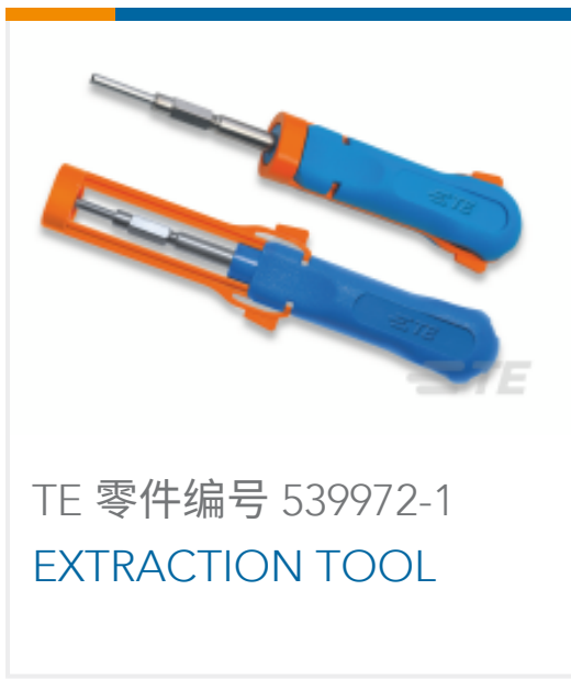
TE 零件编号 539972-1 EXTRACTION TOOL