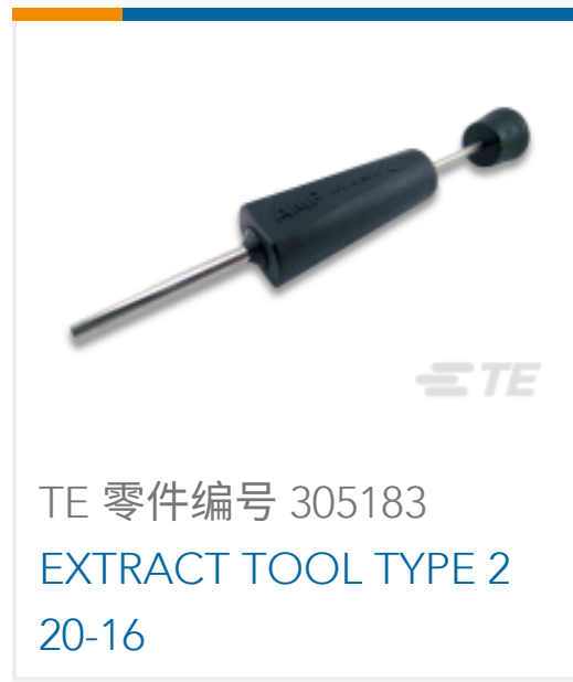
TE 零件编号 305183 EXTRACT TOOL TYPE 2 20-16