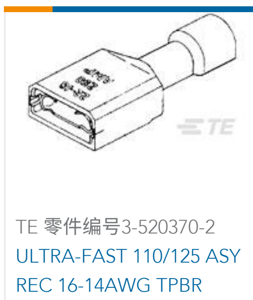
TE 零件编号3-520370-2 ULTRA-FAST 110/125 ASY REC 16-14AWG TPBR