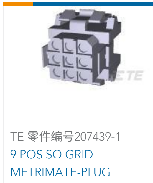
TE 零件编号207439-1 9 POS SQ GRID METRIMATE-PLUG