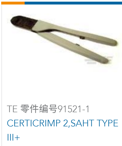
TE 零件编号91521-1 CERTICRIMP 2,SAHT TYPE III+