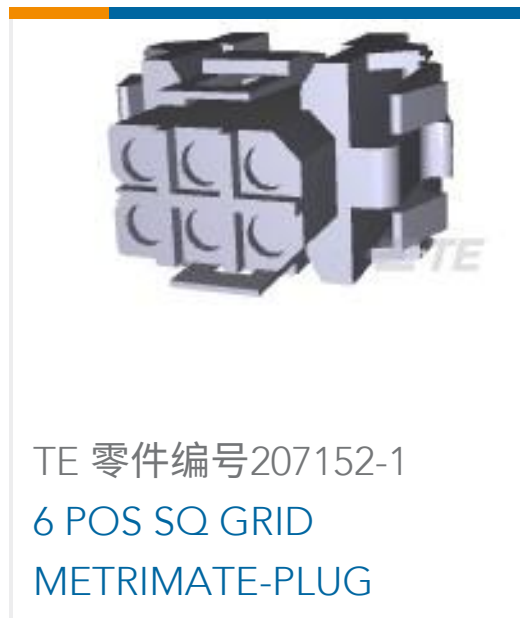
TE 零件编号207152-1 6 POS SQ GRID METRIMATE-PLUG