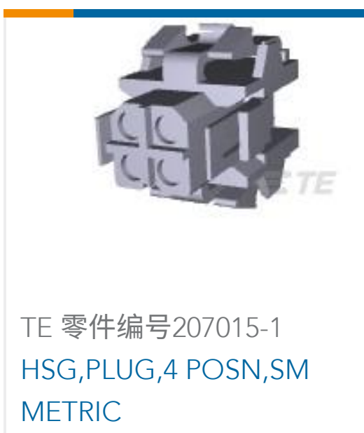
TE 零件编号207015-1 HSG,PLUG,4 POSN,SM METRIC