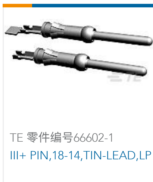
TE 零件编号66602-1 III+ PIN,18-14,TIN-LEAD,LP