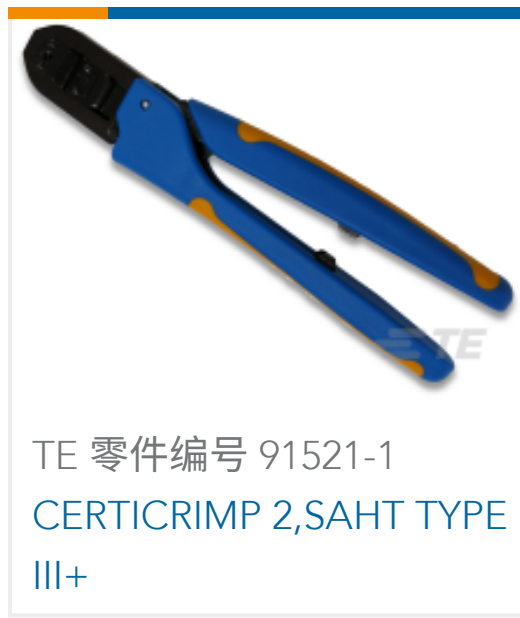
TE 零件编号 91521-1 CERTICRIMP 2,SAHT TYPE III+