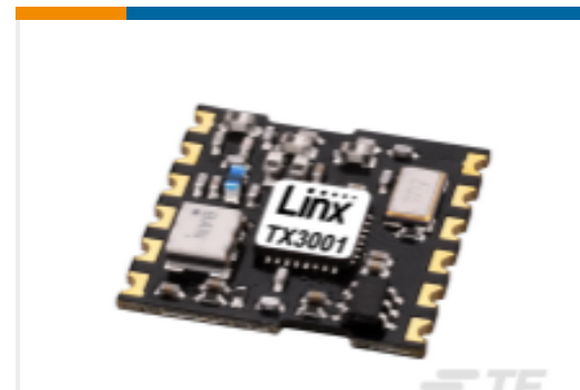
TE 产品编号TRM-315-LT Module LT 315MHz AM OOK XCVR