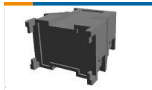
TE 产品编号207088-1 METRIMATE,STR REL KIT,24P