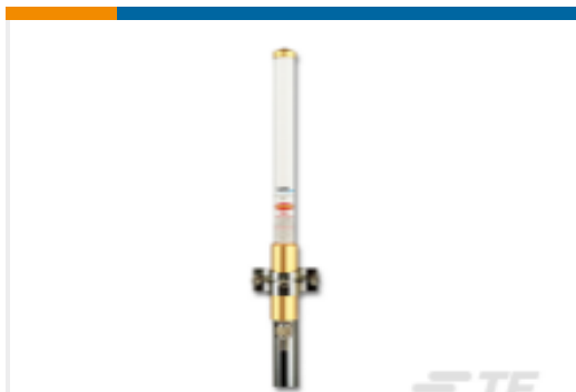
TE 产品编号FG1520 OMNI,FG,152-156MHZ,200W 154MHZ, 2dBi