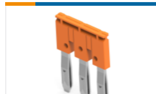
TE 产品编号1SNK908303R0000 JB8-3