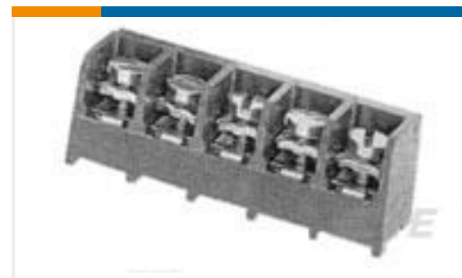
TE 产品编号1437652-5 6PCR-09-006=#6 TRIBARRIER