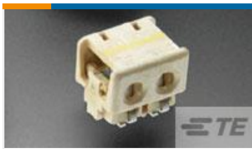
TE 产品编号2106431-2 Connector, SMT-IDC PASS THRU, 2 POS, 18