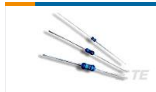
TE 产品编号1622602-1 LR1L 5% R33