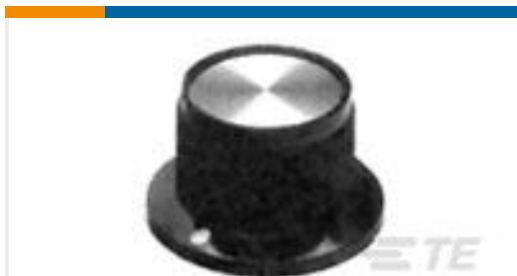
TE 产品编号1437624-8 PK70B1/4=KNOB PLASTIC BLK 1/4