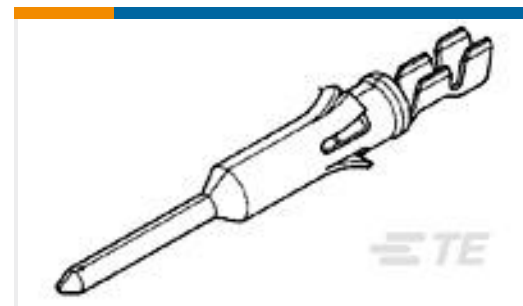
TE 产品编号66579-7 TYPE VI PIN,MULTI-MATE