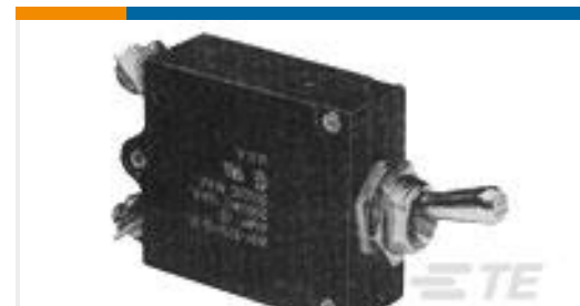
TE 产品编号3-1393247-6 W31-X2M1G-25=W23/W31