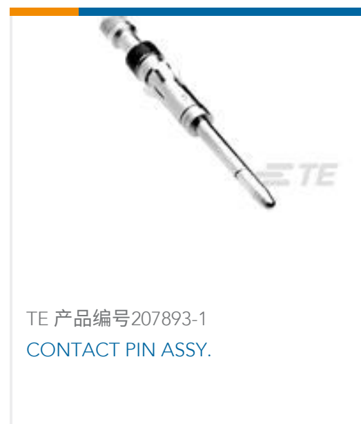
TE 产品编号207893-1 CONTACT PIN ASSY.