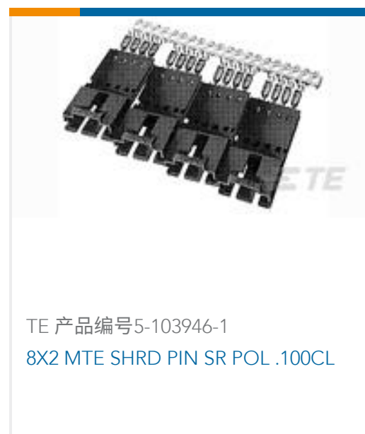
TE 产品编号5-103946-1 8X2 MTE SHRD PIN SR POL .100CL