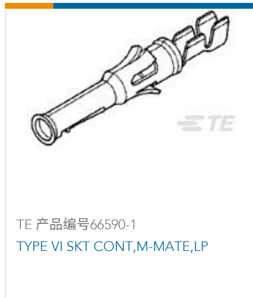
TE 产品编号66590-1 TYPE VI SKT CONT,M-MATE,LP