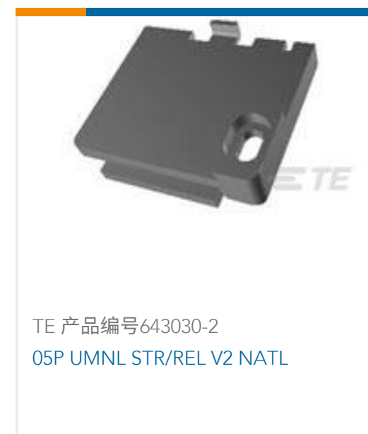
TE 产品编号643030-2 05P UMNL STR/REL V2 NATL