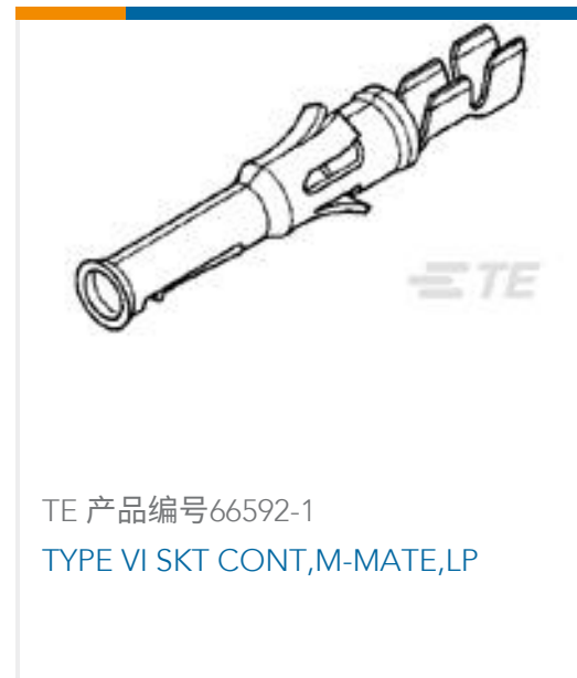
TE 产品编号66592-1 TYPE VI SKT CONT,M-MATE,LP