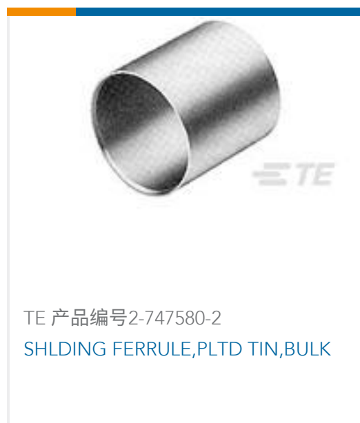
TE 产品编号2-747580-2 SHLDING FERRULE,PLTD TIN,BULK