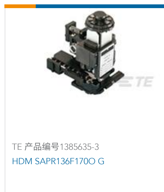
TE 产品编号 1385635-3 HDM SAPR136F1700 G