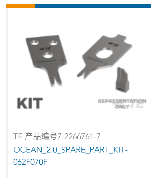
TE 产品编号 7-2266761-7 OCEAN_2.0_SPARE_PART_KIT- 062F070F