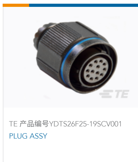
TE 产品编号 YDTS26F25-19SCV001 PLUG ASSY