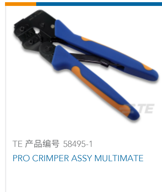
TE 产品编号 58495-1 PRO CRIMPER ASSY MULTIMATE