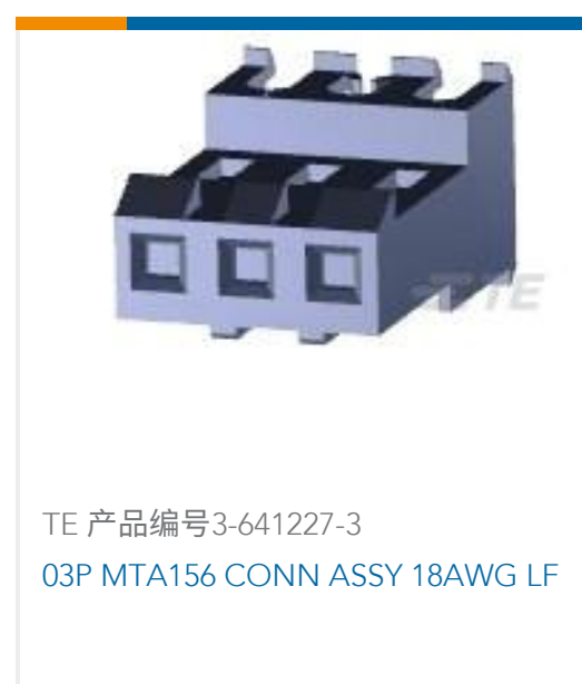
TE 产品编号 3-641227-3 03P MTA156 CONN ASSY 18AWG LF