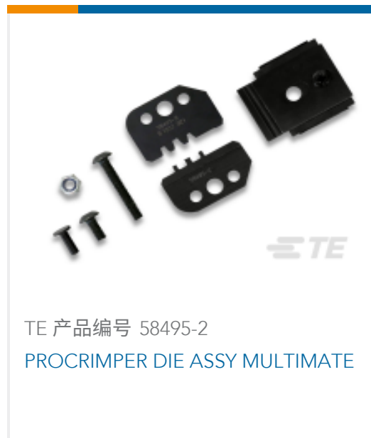
TE 产品编号 58495-2 PROCRIMPER DIE ASSY MULTIMATE