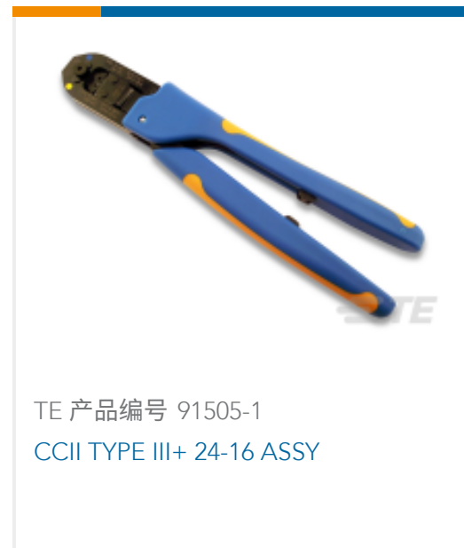
TE 产品编号 91505-1 CCII TYPE III+ 24-16 ASSY