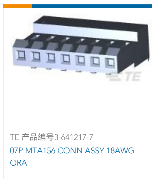
TE 产品编号 3-641217-7 07P MTA156 CONN ASSY 18AWG ORA