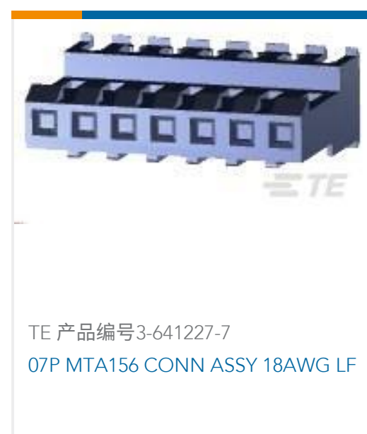
TE 产品编号 3-641227-7 07P MTA156 CONN ASSY 18AWG LF