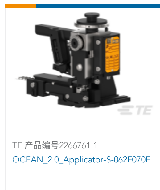
TE 产品编号 2266761-1 OCEAN_2.0_Applicator-S-062F070F