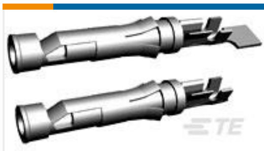
TE 产品编号66601-1 III+ SKT,18-14,TIN-LEAD,LP