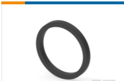
TE 产品编号2267473-1 SIZE 11 PERIPHERAL SEAL, CPC