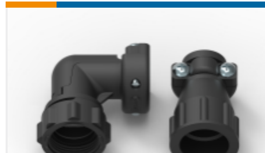
TE 产品编号796379-2 CPC Cable Clamps