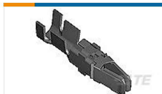
TE 产品编号1-66740-1 TYPE XII FEMALE CONT (STRIP)