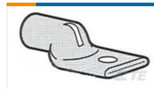
TE 产品编号325405 TERMINAL,AMPOWER 2/0 1/2