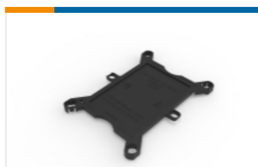
TE 产品编号2305234-1 SOCKET P HARDWARE DUST COVER