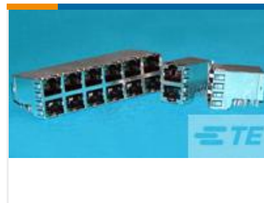
TE 产品编号6368035-4 2X6 OFFSET STK MJ,SHLD,G/Y LED&GND