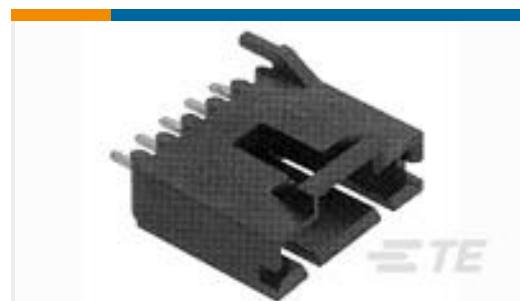
TE 产品编号5-104809-4 05 MTE HDR SRST LATCH W/HLDWN