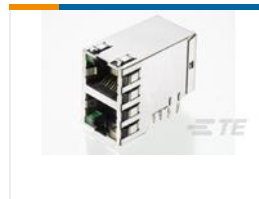
TE 产品编号1888653-5 2X1 OFFSET ST/JK WITH LEDS