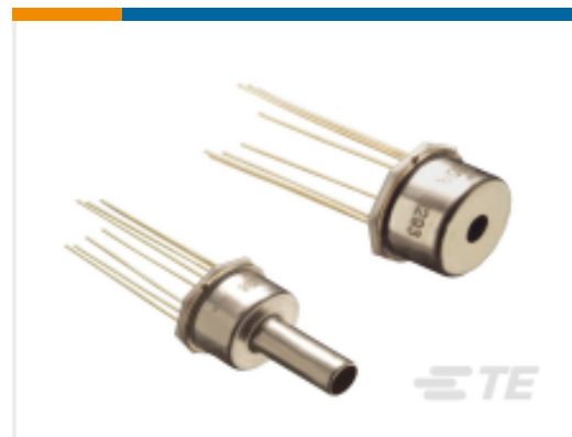
TE 产品编号17-015A 15PSIA BOARD MOUNT PRESSURE SENSOR