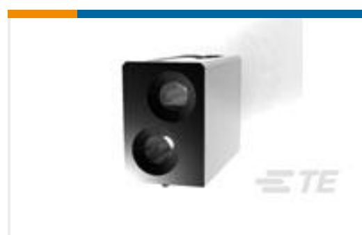
TE 产品编号3-1469373-7 ATCA GUIDE MODULE RA FEMALE