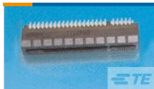
TE 产品编号1871058-3 PCI EXPRESS CONN. EON TYPE, 98