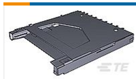
TE 产品编号1871916-1 SD RVS 0H EMOSS ASSY