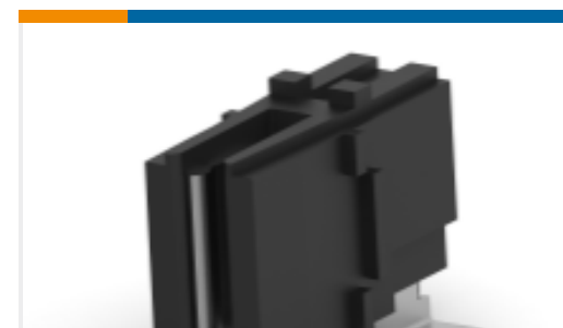
TE 产品编号1982995-3 CROWN CLIP JUNIOR SCREW- MOUNT CONN