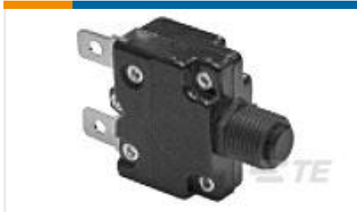
TE 产品编号5-1423364-6 W57-XB6A99C10-10=CKTBKR,THERM, PB,QC.250