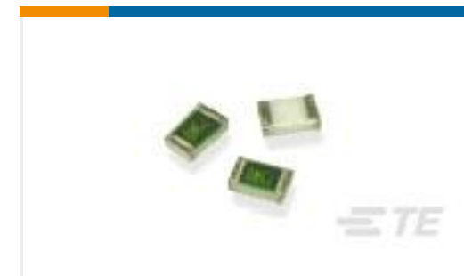
TE 产品编号4-2176087-2 RP 1J 0.166W 182R 0.1% 25PPM 1K RL