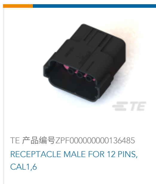
TE 产品编号ZPF000000000136485 RECEPTACLE MALE FOR 12 PINS, CAL1,6