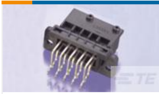
TE 产品编号1-963215-1 16P STIFTWANNE 3MM