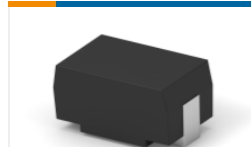
TE 产品编号1-1879022-7 SMD 功率电阻器 : 7 瓦特 , 200-2M 欧姆