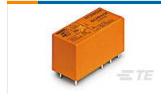
TE 产品编号6-1393243-3 RT424012