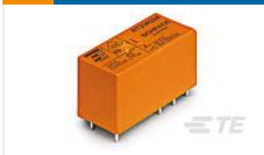
TE 产品编号3-1393240-3 RT33L012