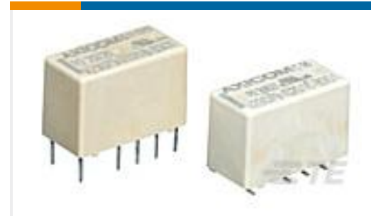
TE 产品编号5-1393789-1 V23079G2003B301