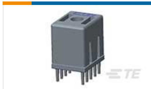
TE 产品编号6643264-1 ICCON,SKT,ASSY