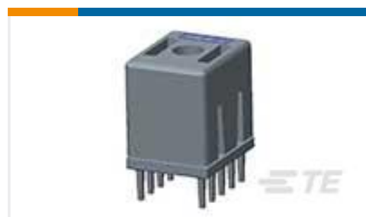
TE 产品编号 6643264-1 ICCON,SKT,ASSY