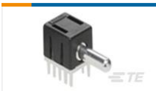
TE 产品编号6643433-1 ICCON,PIN,ASSY