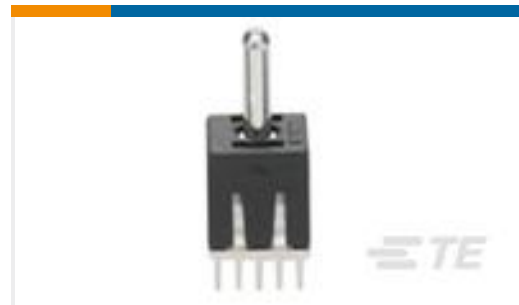
TE 产品编号6643274-1 ICCON,PIN,ASSY