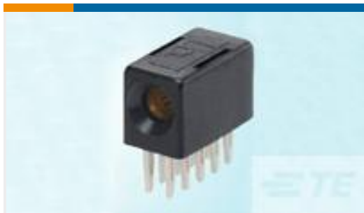
TE 产品编号6643220-1 SLIMLINE,ICCON,SKT,ASSY