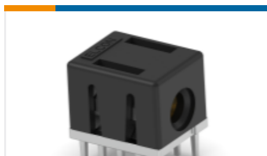
TE 产品编号6643232-1 ICCON,SKT,ASSY