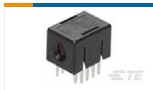
TE 产品编号 6643272-1 ICCON,SKT,ASSY