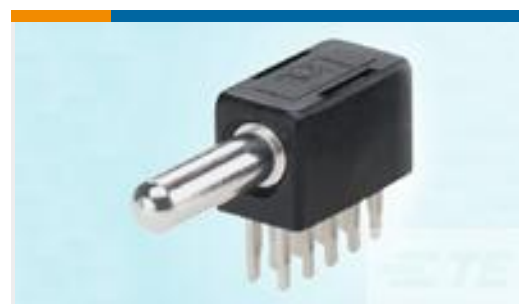
TE 产品编号6643222-1 SLIMLINE,ICCON,PIN,ASSY