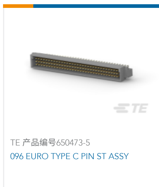
TE 产品编号650473-5 096 EURO TYPE C PIN ST ASSY