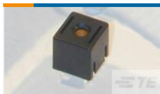
TE 产品编号 6643269-1 ICCON,SKT,ASSY