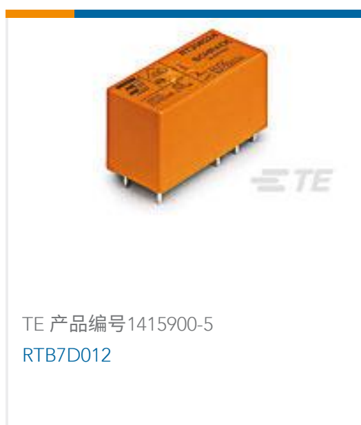
TE 产品编号1415900-5 RTB7D012