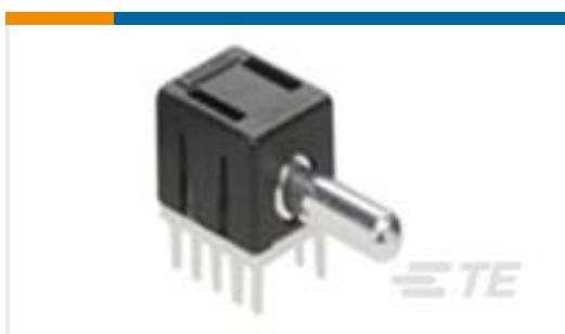
TE 产品编号6643433-1 ICCON,PIN,ASSY