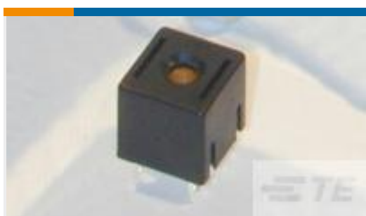
TE 产品编号6643269-1 ICCON,SKT,ASSY