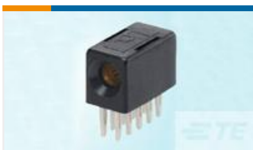
TE 产品编号6643220-1 SLIMLINE,ICCON,SKT,ASSY