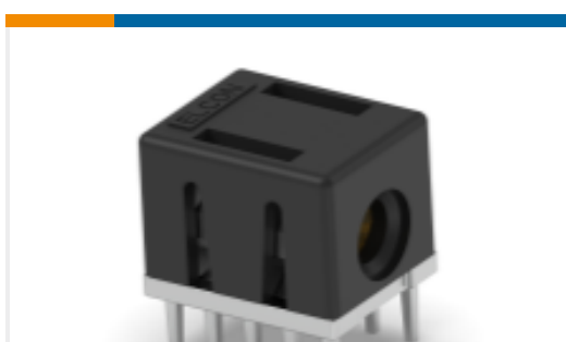
TE 产品编号6643232-1 ICCON,SKT,ASSY