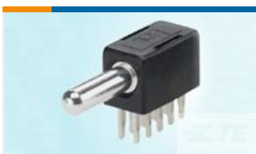
TE 产品编号6643228-1 SLIMLINE,ICCON,PIN,ASSY