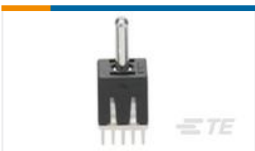
TE 产品编号6643274-1 ICCON,PIN,ASSY