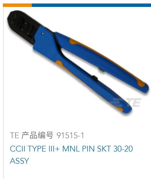
TE 产品编号 91515-1 CCII TYPE III+ MNL PIN SKT 30-20 ASSY