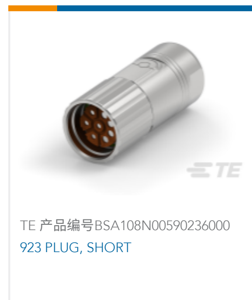
TE 产品编号BSA108N00590236000 923 PLUG, SHORT