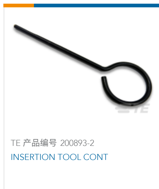
TE 产品编号 200893-2 INSERTION TOOL CONT