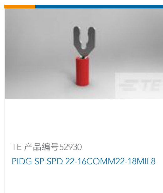
TE 产品编号52930 PIDG SP SPD 22-16COMM22-18MIL8