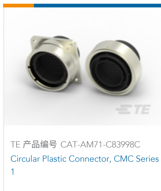
TE 产品编号 CAT-AM71-C83998C Circular Plastic Connector, CMC Series 1