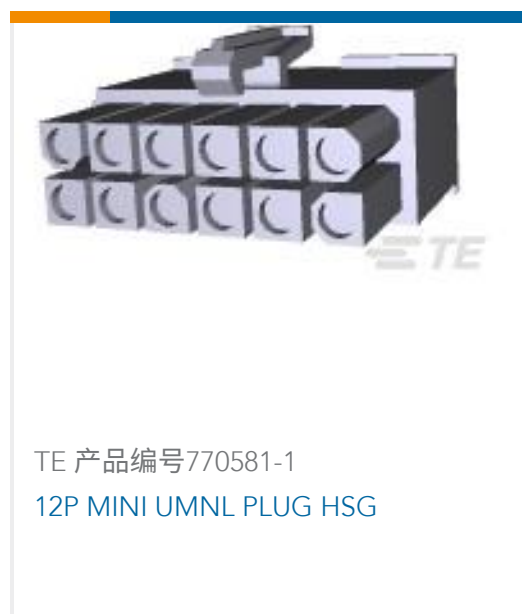
TE 产品编号770581-1 12P MINI UMNL PLUG HSG