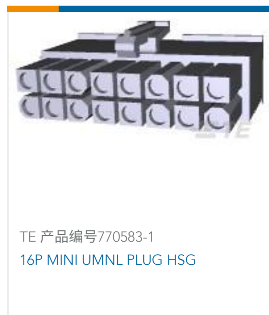
TE 产品编号770583-1 16P MINI UMNL PLUG HSG