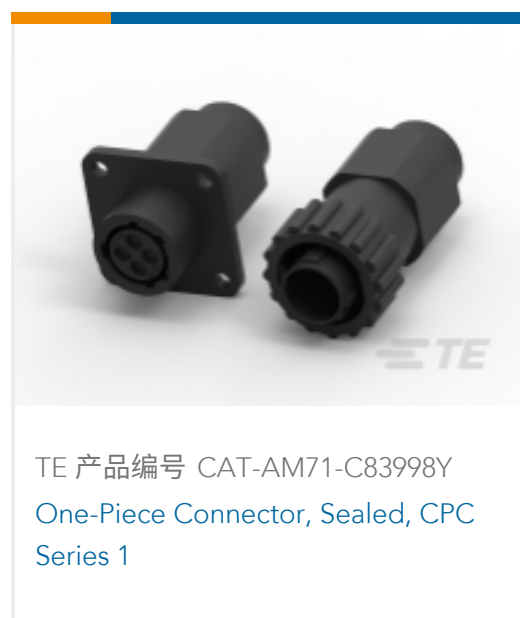
TE 产品编号 CAT-AM71-C83998Y One-Piece Connector, Sealed, CPC Series 1