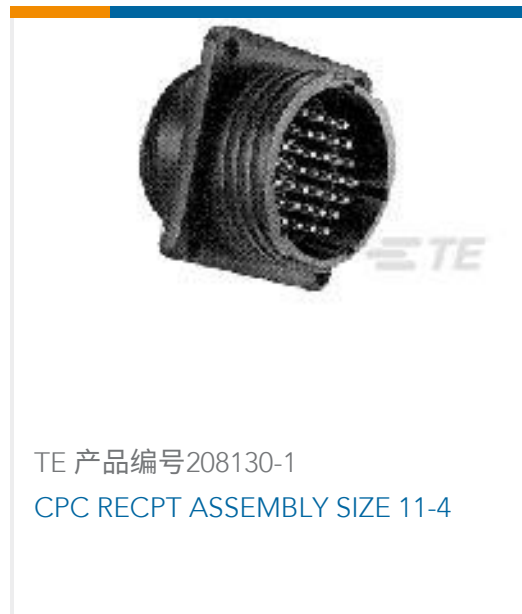
TE 产品编号208130-1 CPC RECPT ASSEMBLY SIZE 11-4