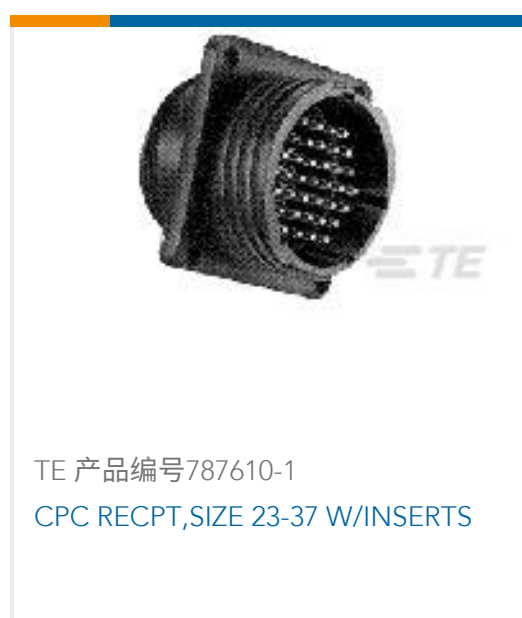
TE 产品编号787610-1 CPC RECPT, SIZE 23-37 W/INSERTS