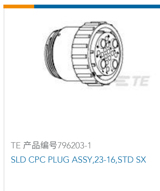
TE 产品编号796203-1 SLD CPC PLUG ASSY, 23-16, STD SX