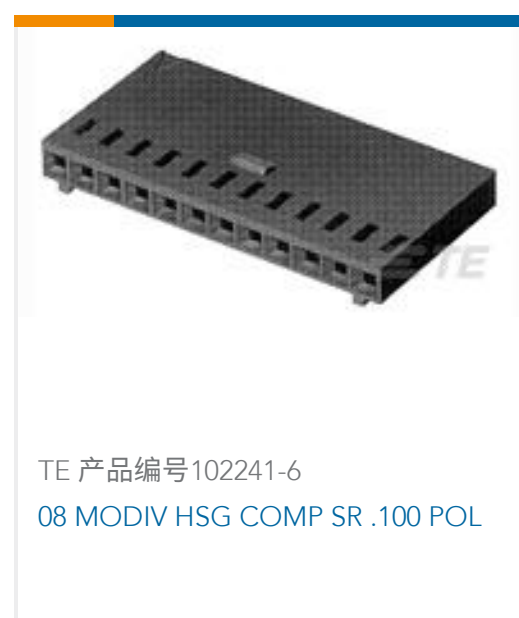
TE 产品编号102241-6 08 MODIV HSG COMP SR .100 POL