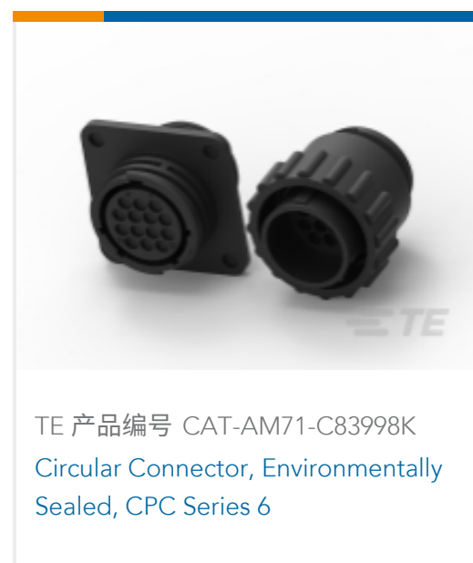
TE 产品编号 CAT-AM71-C83998K Circular Connector, Environmentally Sealed, CPC Series 6