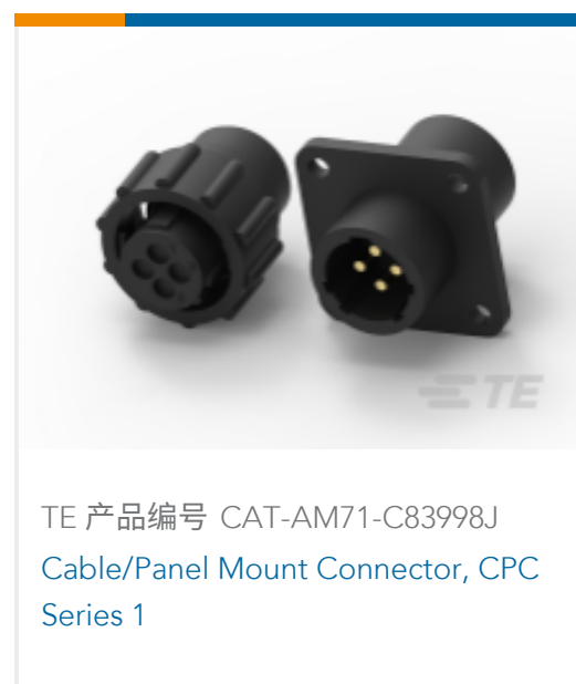
TE 产品编号 CAT-AM71-C83998J Cable/Panel Mount Connector, CPC Series 1