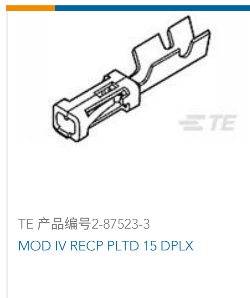
TE 产品编号2-87523-3 MOD IV RECP PLTD 15 DPLX