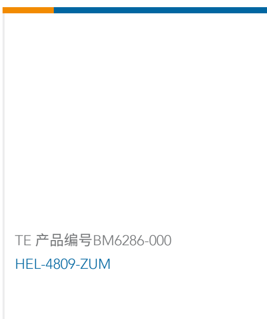
TE 产品编号BM6286-000 HEL-4809-ZUM