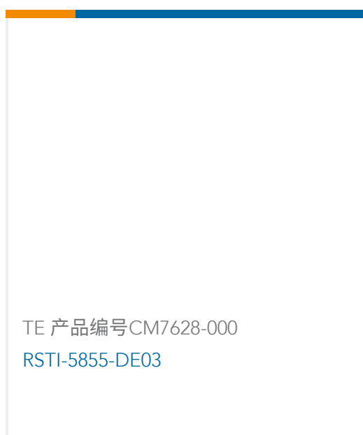
TE 产品编号CM7628-000 RSTI-5855-DE03