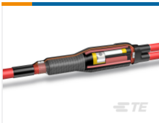
TE 产品编号CX7296-005 MXSB-24C/1XU-2XU