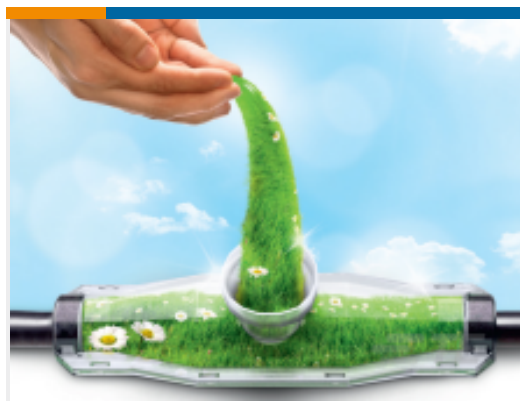
TE 产品编号445728-000 MM-5-GD160