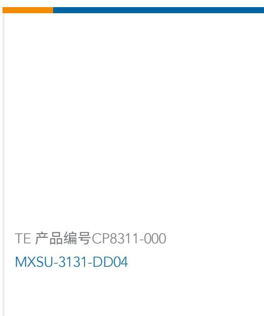
TE 产品编号CP8311-000 MXSU-3131-DD04