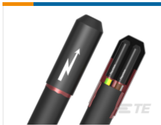
TE 产品编号973301-000 EPKE-0024-(S25)