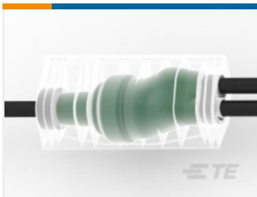
TE 产品编号E35138-000 MM-7-GD490