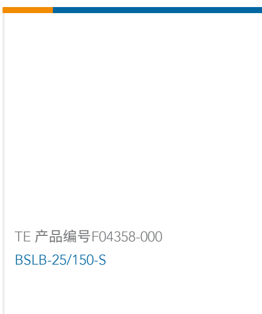
TE 产品编号F04358-000 BSLB-25/150-S