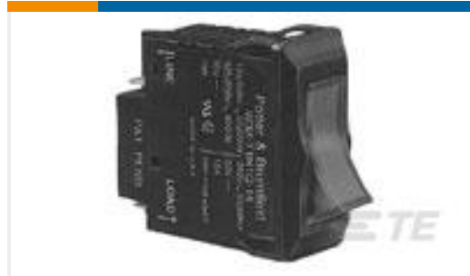
TE 产品编号1-1393248-1 W33-S1N1Q-5=W33