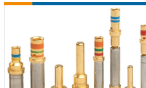
TE 产品编号12333-22 CONT SOC ASSY