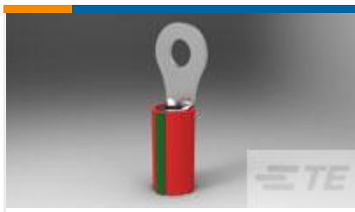
TE 产品编号51863-2 TERMINAL PIDG R IR 22 6