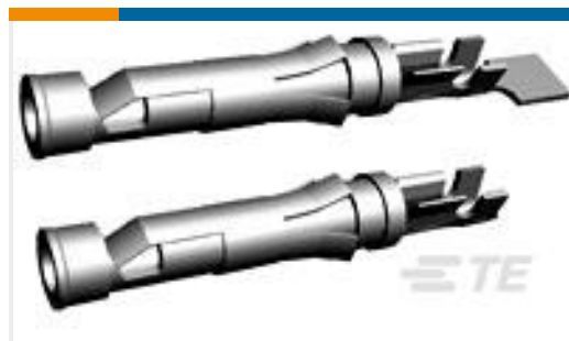
TE 产品编号1-66399-0 III+ SKT,24-20,TIN ,LP