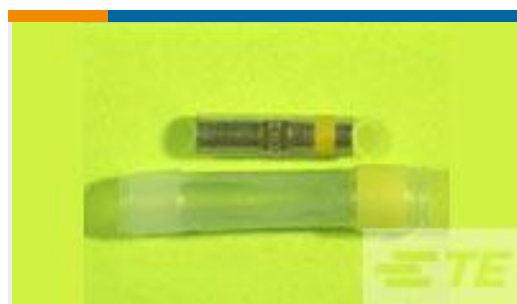
TE 产品编号650075N003 D-436-37CS454