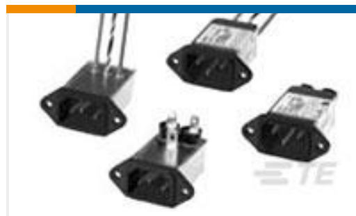
TE 产品编号6609015-5 6EF1F=F7325 S0