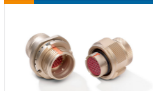
TE 产品编号ZPF000000000005719 941-20 B 27