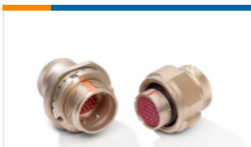
TE 产品编号ZPF000000000005854 941-21 A 37-0 SN