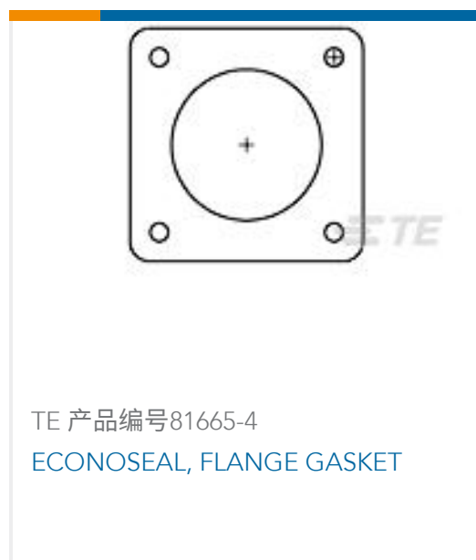
TE 产品编号81665-4 ECONOSEAL, FLANGE GASKET