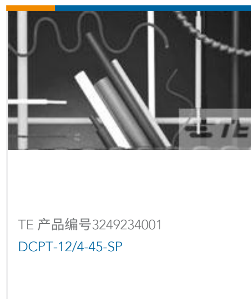
TE 产品编号3249234001 DCPT-12/4-45-SP