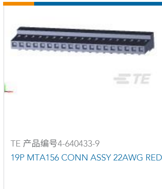
TE 产品编号4-640433-9 19P MTA156 CONN ASSY 22AWG RED