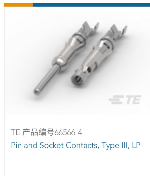
TE 产品编号66566-4 Pin and Socket Contacts, Type III, LP