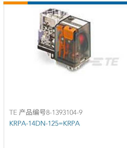
TE 产品编号8-1393104-9 KRPA-14DN-125=KRPA