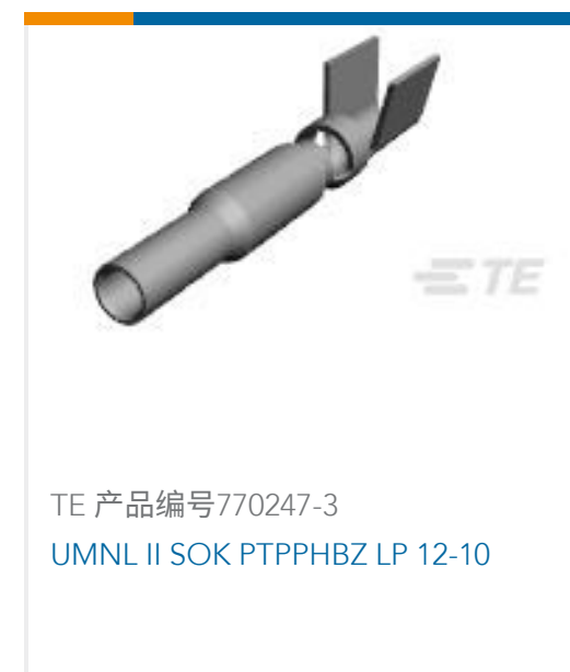
TE 产品编号770247-3 UMNL II SOK PTPPHBZ LP 12-10