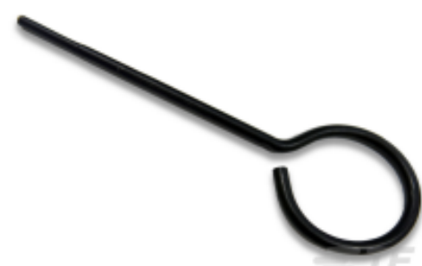
TE 产品编号 200893-2 INSERTION TOOL CONT