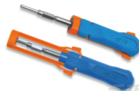
TE 产品编号 539972-1 EXTRACTION TOOL