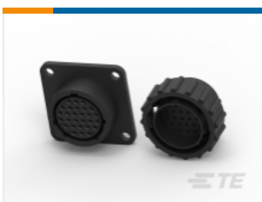
TE 产品编号205843-2 CPC Connectors, Series 2