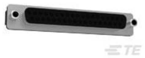
TE 产品编号5787685-1 37 RCPT SP/FMS (RET SL)