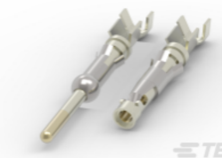
TE 产品编号1-66359-0 Strip Pin and Socket Contacts, Type III