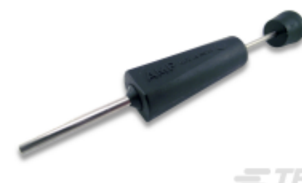
TE 产品编号 305183 EXTRACT TOOL TYPE 2 20-16