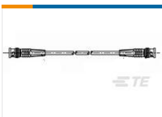
TE 产品编号1337771-4 50 OHM COAX BNC STR PLUG STR P