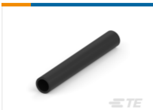
TE 产品编号0915756003 LSTT-R-9.5-0