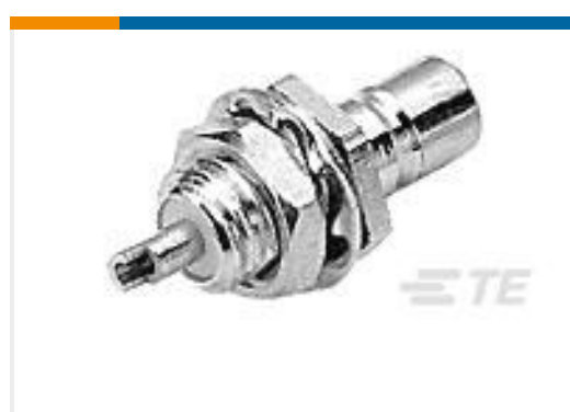
TE 产品编号1-1337480-0 SMB FM BHSkt 50Ohm Gold Pltd