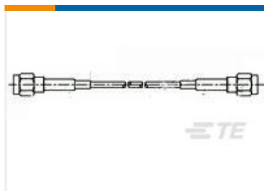
TE 产品编号1337808-1 50 OHM COAX SMA STR PLUG STR P