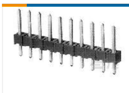
TE 产品编号1-826629-6 16X1 AMPMODU II HDR ST