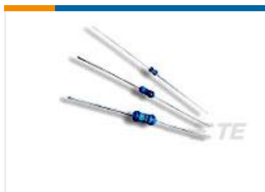
TE 产品编号1-1879026-5 YR1 0.1% 143R