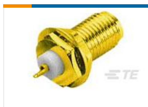
TE 产品编号1-1478966-0 SMA B/HD SKT RCPT GSS