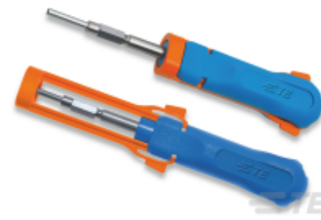
TE 产品编号 539972-1 EXTRACTION TOOL