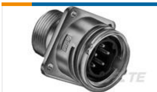
TE 产品编号208459-1 CMC RECPT ASSEMBLY SIZE 28