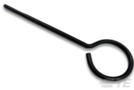
TE 产品编号 200893-2 INSERTION TOOL CONT