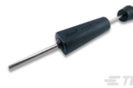
TE 产品编号 305183 EXTRACT TOOL TYPE 2 20-16