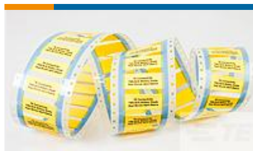
TE 产品编号5883010001 TMS-SCE-3/16-2.0-S1-4