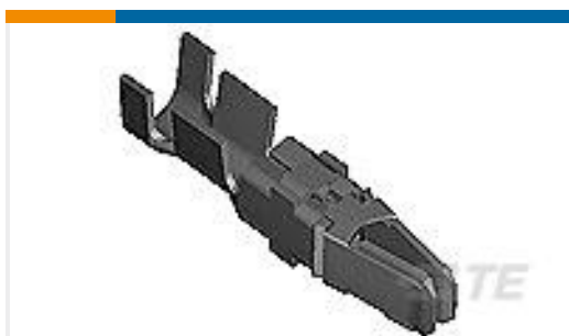
TE 产品编号66740-5 TYPE XII FEMALE CONT (STRIP)