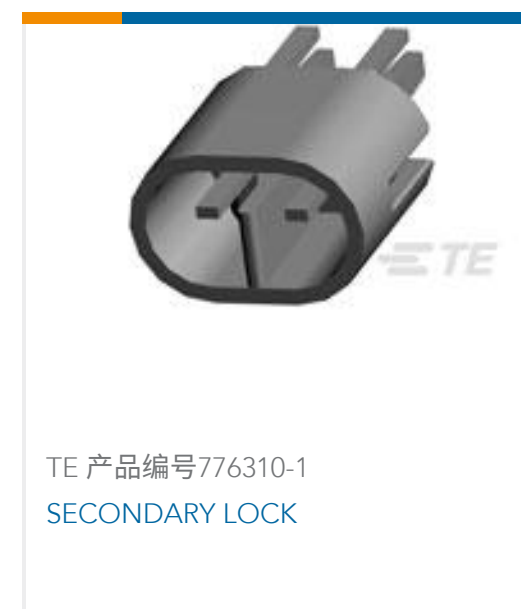
TE 产品编号776310-1 SECONDARY LOCK