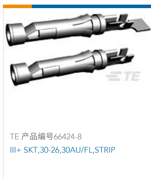
TE 产品编号66424-8 III+ SKT,30-26,30AU/FL,STRIP