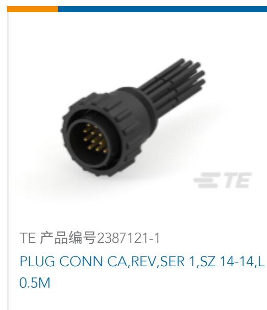
TE 产品编号2387121-1 PLUG CONN CA,REV,SER 1,SZ 14-14,L 0.5M