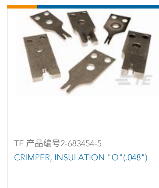
TE 产品编号2-683454-5 CRIMPER, INSULATION "O"(.048")