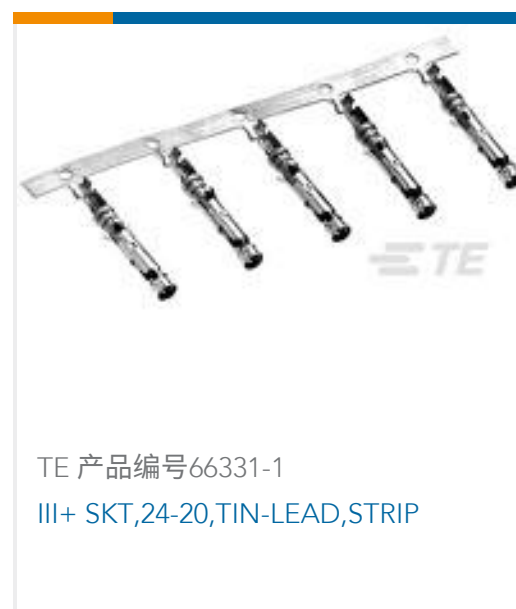
TE 产品编号66331-1 III+ SKT,24-20,TIN-LEAD,STRIP