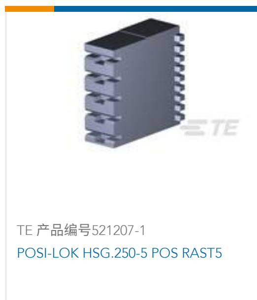
TE 产品编号521207-1 POSI-LOK HSG.250-5 POS RAST5