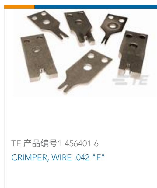
TE 产品编号1-456401-6 CRIMPER, WIRE .042 "F"