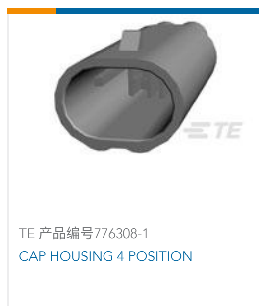
TE 产品编号776308-1 CAP HOUSING 4 POSITION