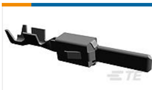
TE 产品编号2-962841-1 TAB 2.8x0.8 CONTACT CF SRC Sn