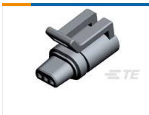
TE 产品编号1879980-1 MINI SUPERSEAL CONNECTOR