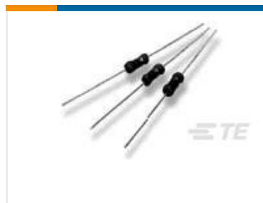
TE 产品编号5-1625892-5 3W SM M/OX 5% 4K7