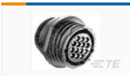
TE 产品编号182919-1 CPC FR-HANG RCP