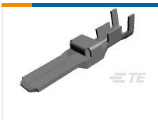
TE 产品编号917805-3 DYNAMIC D-5 TAB CONT. M L/P