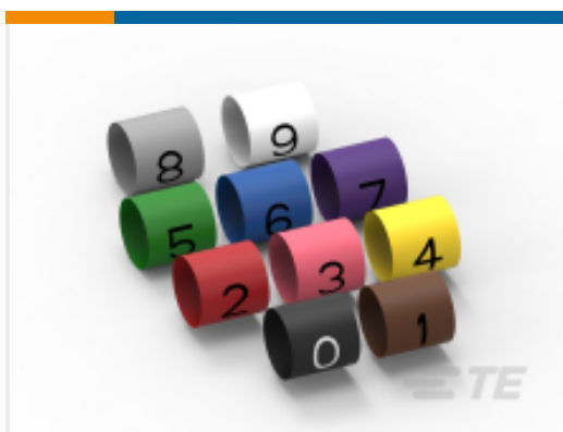
TE 产品编号8002280001 TRSA-1011/C/1/1