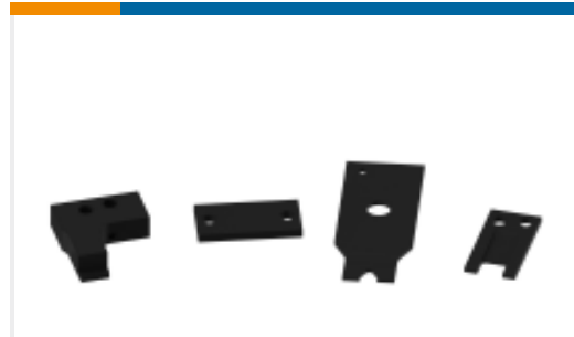
TE 产品编号2119806-1 INSERT, SHEAR