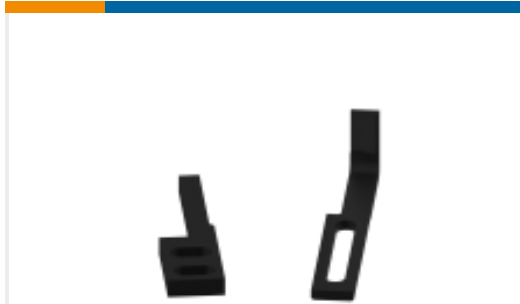
TE 产品编号2119533-1 STRIPPER, SIDE FEED