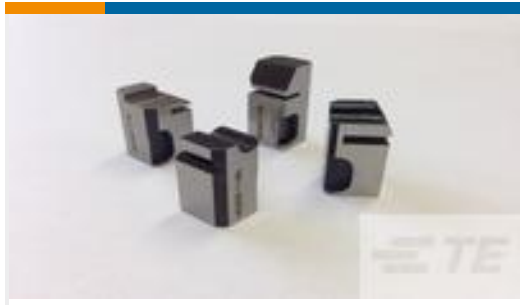
TE 产品编号1803095-1 FLOATING SHEAR, FRONT