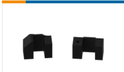
TE 产品编号2119805-1 SHEAR HOLDER, FRONT, CUT