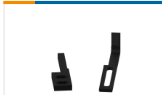
TE 产品编号2119534-1 MOUNT, STRIPPER, SIDE FEED